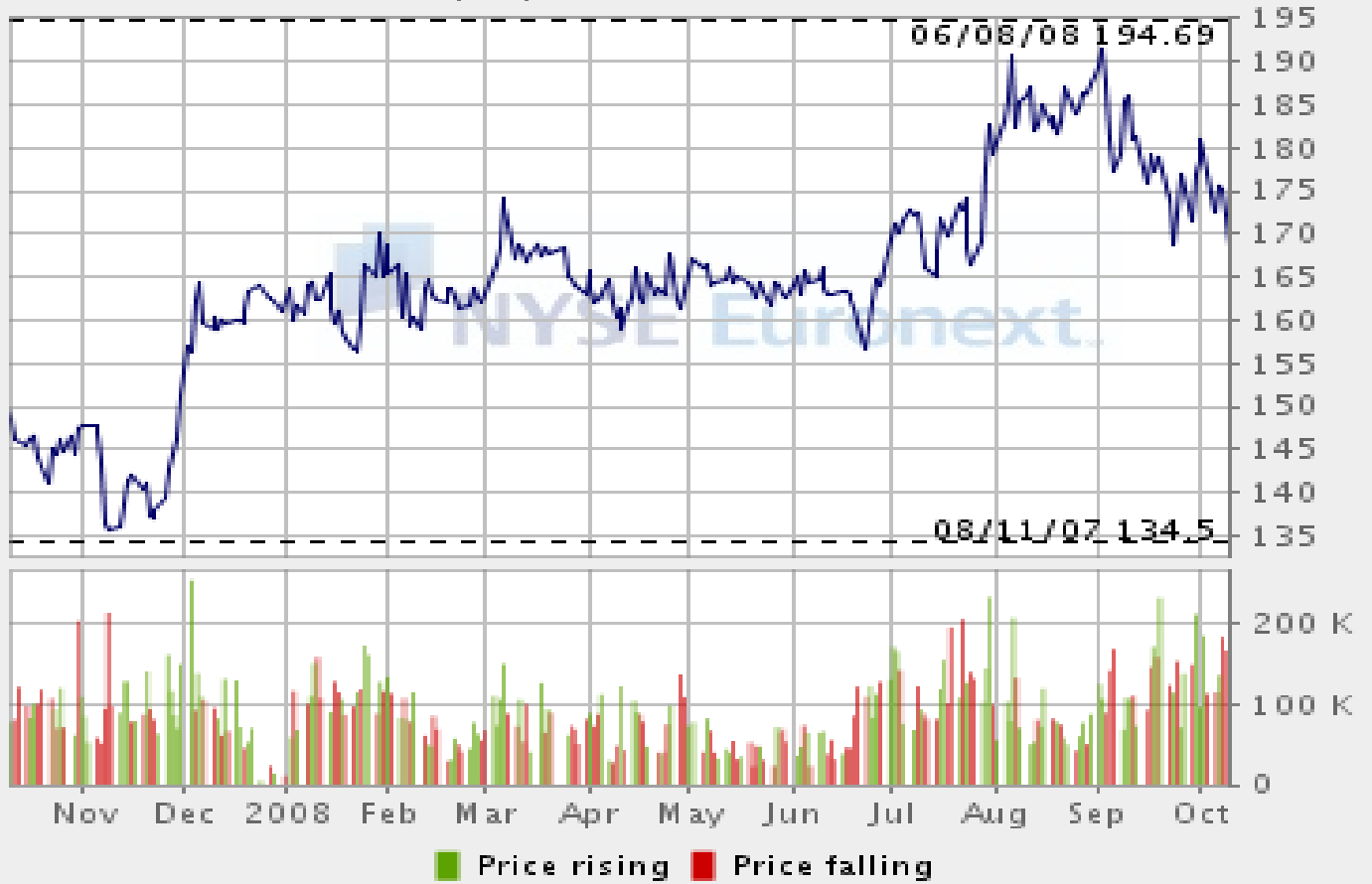
COLRUYT - Historic chart (EUR)