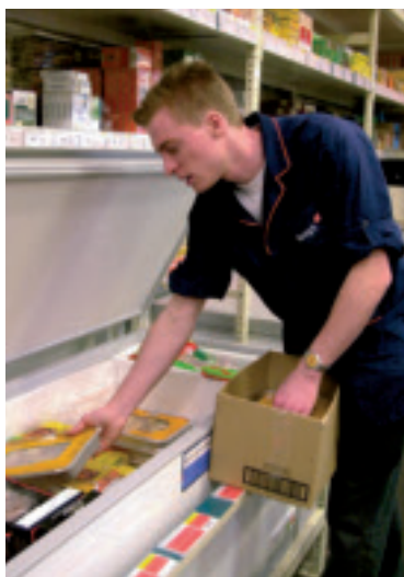
En choisissant notamment des surgélateurs-coffres fermés horizontaux, nous économisons beaucoup d'énergie.

Produire soi-même de l'électricité verte n'est qu'un des aspects de la politique énergétique suivie par Colruyt. Partout dans la firme, nous économisons l'énergie là où c'est possible, par ex. grâce à des installations à haut rendement, une bonne isolation, etc.