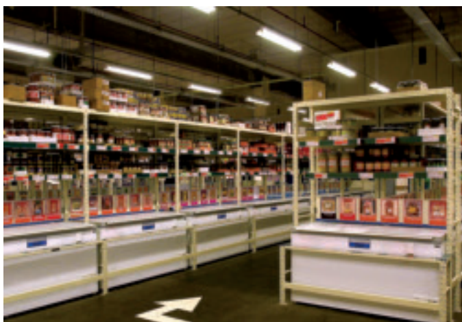
L'éclairage des magasins Colruyt est fonctionnel: suffisamment de lumière sans gaspiller d'énergie.