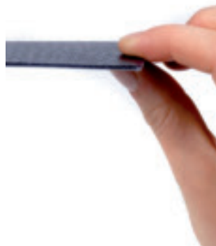
Les panneaux ne font que 2 mm d'épaisseur. Ils sont dès lors très faciles à placer.

Dans des conditions optimales, des panneaux plus épais peuvent fournir un meilleur rendement. Mais puisque les conditions climatiques sont très variables en Belgique, l'écart de rendement entre les deux modèles est très minime, en ce qui nous concerne.