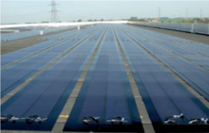
Les panneaux solaires installés au centre de distribution de Dassenveld ont une superficie totale de 8.000 m 2 : c'est la plus grande installation de panneaux solaires en Belgique.

8.000 m 2 de panneaux solaires au total sont disposés sur le toit de notre centre de distribution de Dassenveld. C'est environ la surface d'un terrain de football, et par la même occasion la plus grande installation solaire en Belgique.