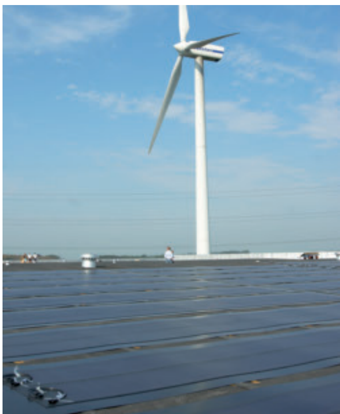
La combinaison de l'éolienne et des panneaux solaires nous permet de disposer d'énergie verte durant 80 % du temps.

Grâce à la complémentarité de l'éolienne et des panneaux solaires, nous disposons durant 80 % du temps d'électricité verte , que nous utilisons directement dans notre centre de distribution. Les panneaux solaires à Halle complètent bien l'éolienne. En hiver , l'éolienne atteint son rendement le plus élevé grâce aux nombreuses heures d'exposition au vent. En été , il y a moins de vent mais davantage de luminosité. De plus, l'angle d'incidence de la lumière sur les panneaux solaires est plus droit, ce qui fournit un meilleur rendement.