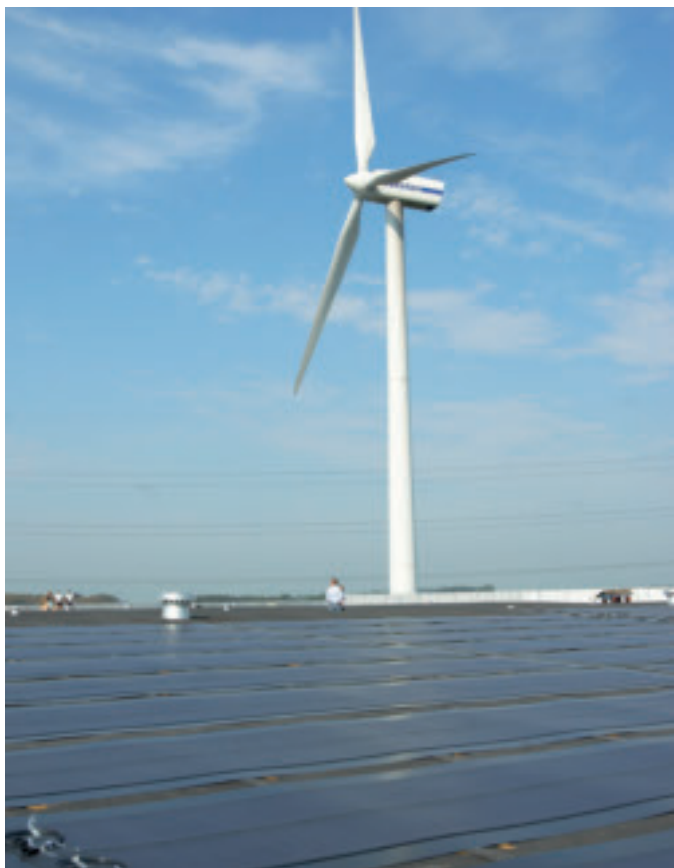
Dankzij de combinatie van windmolen en zonnepanelen beschikken we 80 % van de tijd over groene energie.

Door de combinatie van windmolen en zonnepanelen hebben we 80 % van de tijd groene stroom ter beschikking, die we onmiddellijk gebruiken in ons distributiecentrum. De zonnepanelen in Halle vullen de windmolen goed aan. In de winter is er meer wind, waardoor de molen een hoog rendement haalt. In de zomer is er dan weer minder wind, maar wel overvloedig zonlicht dat bovendien in een rechttere hoek invalt, waardoor de zonnepanelen beter renderen.