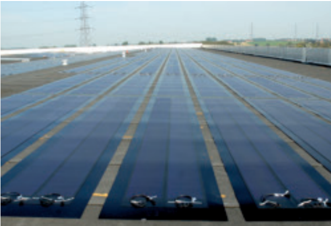
De zonnepanelen op ons distributiecentrum Dassenveld beslaan een totale oppervlakte van 8.000 vierkante meter: de grootste zonne-installatie in België.

In totaal liggen er op het dak van ons distributiecentrum Dassenveld 8.000 m 2 zonnepanelen . Dat is ongeveer de oppervlakte van een voetbalveld, en daarmee ook meteen de grootste zonne-installatie in België.