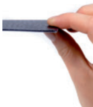
De zonnepanelen zijn maar 2 mm dik. Daardoor zijn ze makkelijk te plaatsen op het dak.

Dikkere panelen halen in optimale omstandigheden een beter rendement. Maar omdat de omstandigheden in België zeer wisselvallig zijn, is het verschil in rendement voor onze toepassing tussen beide types minimaal.